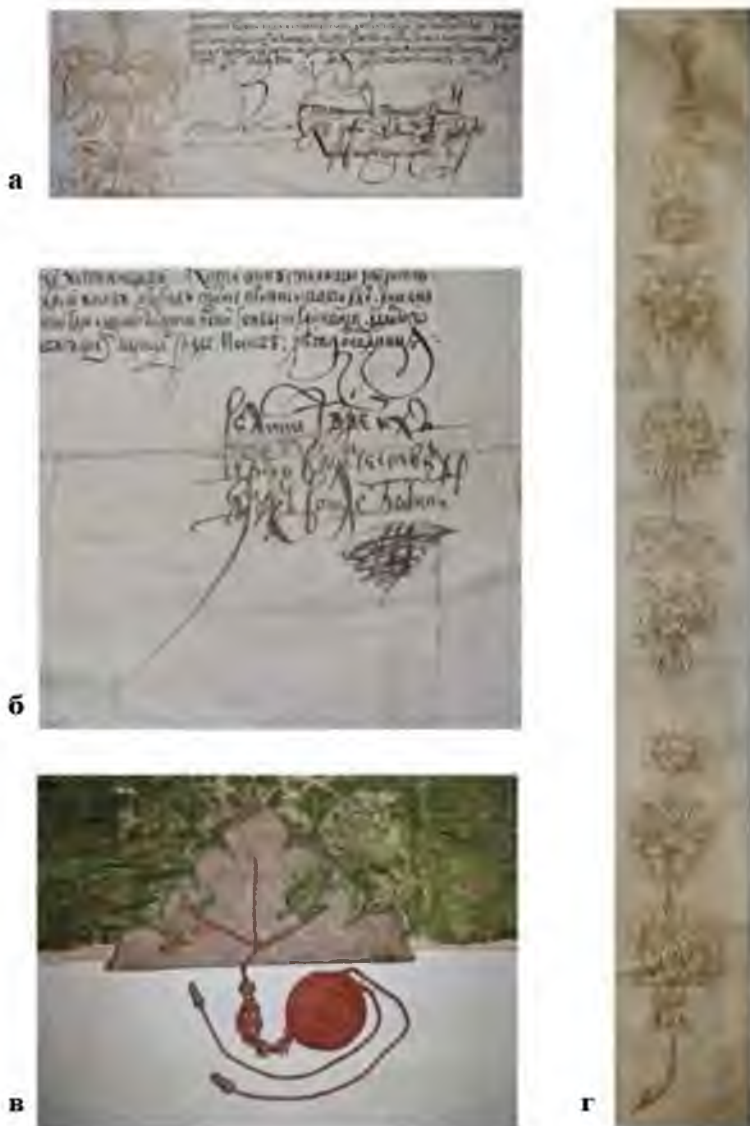
Ил. 4. Жалованная грамота царей Иоанна Алексеевича и Петра Алексеевича крестьянам Устьянских волостей. 1692 г., мая 17 // Архив СПбИИ РАН. РС. Колл. 238 (Коллекция Н. П. Лихачева). Оп. 2. Карт. 247. Д. 20