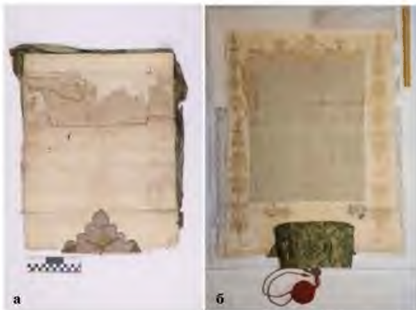
Ил. 3. Жалованная грамота царей Иоанна Алексеевича и Петра Алексеевича крестьянам Устьянских волостей. 1692 г., мая 17 // Архив СПбИИ РАН. РС. Колл. 238 (Коллекция Н. П. Лихачева). Оп. 2. Карт. 247. Д. 20. (а) л. 2 об. — вид до реставрации; (б) л. 1 — вид во процессе реставрации

2021–2022 гг. документы прошли полную реставрацию в СПбИИ РАН 11 , которая позволила начать их изучение и подготовить публикацию текста.