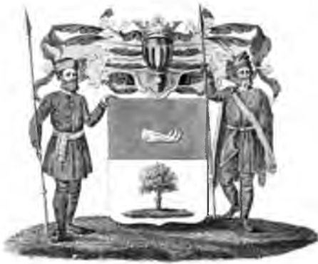
Ил. 1. Герб рода Бакуниных 3

В официальном гербовнике дворянских родов Всероссийской империи была зафиксирована именно эта легендарная версия происхождения рода, а в самом гербе Бакуниных, Высочайше утверждённом 22.10.1800 г. 4 , оказалось отражено несколько элементов, прямо указывающих на их родство с трансильванскими Баториями, род которых считается пресёкшимся в XVII в.: в верхней части щита изображена волчья челюсть с тремя серебряными зубами, а в качестве щитодержателей изображены «два Венгерца в древнем их одеянии с копьями» 5 .