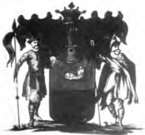
Ил. 2. Рукописный «герб фамилии Бакуниных», составленный в 1800 г. для внесения в гербовник (оригинал утрачен) 9

Первые документальные упоминания о представителях рода Бакуниных зафиксированы уже в середине XVI в., т. е. спустя немногим более полувека после описываемого в предании приезда их предполагаемых предков в Россию, но реальной генеалогической связи с ними – за последние полтора столетия никем из исследователей так и не было выявлено. Один из первых летописцев рода Бакуниных, А. А. Корнилов писал по этому поводу: «В семейных преданиях сохранились малодостоверные