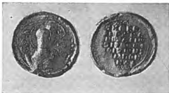
Рис. 3. Печать Феодула, императорского нотариуса, одного из заведующих богохранимой опочивальни и симпона (М-6135, лицевая и оборотная стороны).

веста и ἐπὶ τῶν οἰκησάδων, становится известным уже не пять, а шесть ступеней его cursus honorum (о четырех из них свидетельствуют печати, что является еще одним подтверждением ценности печатей как исторического источника). Указание на неизвестную прежде должность Николая Склира — ἐπὶ τῶν οἰκησάδων — открывает новую страницу в биографии этого человека.