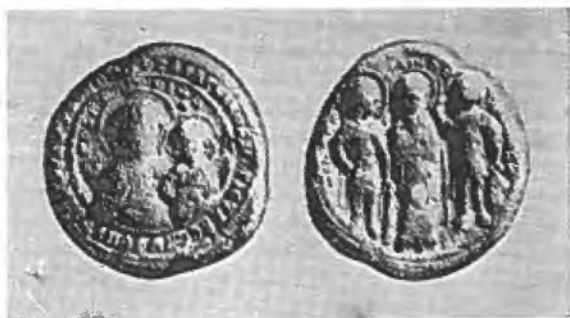
Рис. 2. Печать Николая Склира, магистра, веста и ἐπί τῶν οἰκειακῶν (M-4413, лицевая и оборотная стороны).

в настоящее время в собрании Нумизматического кабинета Художественно-исторического Музея г. Вены. 23 Н. П. Лихачев оказался прав.