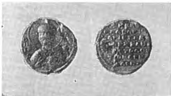
Рис. 4. Печать Власакия Веридара, магистра, вестарха и дуки флота (М-6899, лицевая и оборотная стороны).

обороте надпись в шесть строк: + Κύριε βοήθει Βλασακίω μαγίστρω, βε- στάρχη καὶ δουκὶ τοῦ στόλου τῷ Πε... XI в.