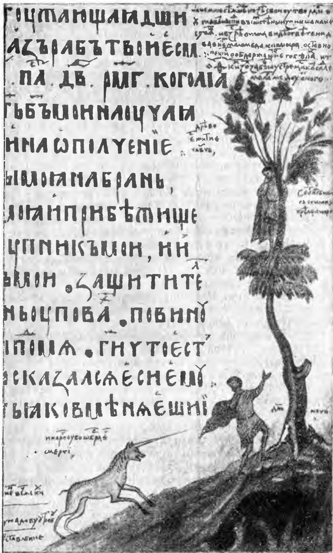
Рис. 1. Миниатюра Псалтыри 1397 г. «Притча о единороге» Жития Варлаама и Иоасафа. Человек, увлекшийся диким медом, не замечает, как белая и черная мыши (день и ночь) подгрызают корни дерева; внизу единорог — «образ смерти».