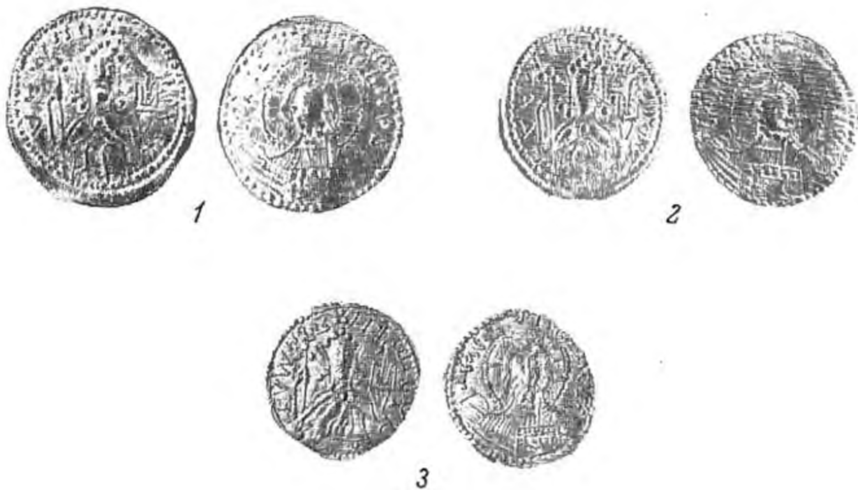
Рис. 4. Златники Кипбурнского клада 1863 г.