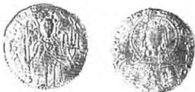
Рис. 3. Златник, приобретенный в Киеве в 1876 г.