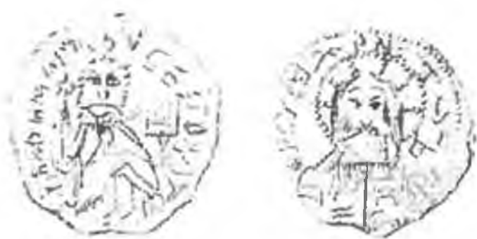
Рис. 1. Златник, приобретенный в Киеве в 1796 г., потерянный там же в 1821 г.